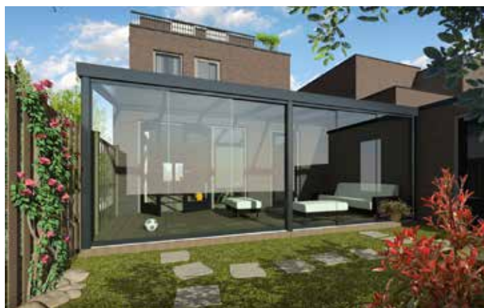
Glasschuifwand Fiësta in RAL 9001.

Rainbowsol heeft als aanvulling op zijn succesvolle verandadak Fiësta een zijwand en een spiekozijn in het programma die zowel in een uitvoering met polycarbonaat als met glas leverbaar zijn. Beide producten kunnen standaard worden uitgevoerd in RAL 9001 en in de Limited Edition uitvoeringen RAL 7016 structuur en RAL 9007 structuur, maar ze kunnen ook in alle andere RAL kleuren worden geleverd.