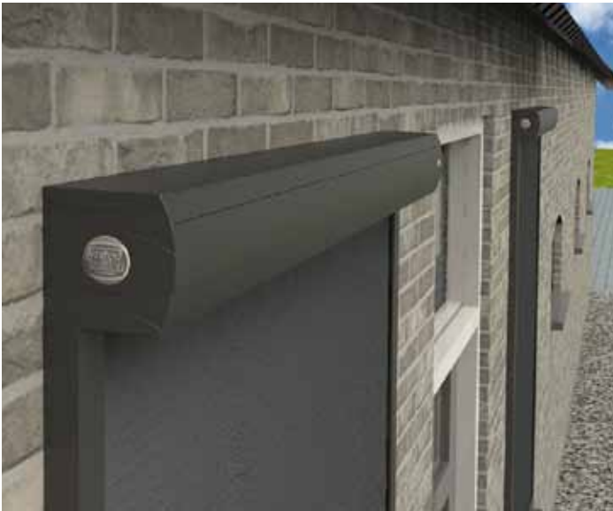
Rainbowsol Zipscreen Limited Edition.

Deze geleiders zijn slechts 40 mm breed (slechts 10 mm breder dan standaardgeleiders). De diepte is met 28 mm gelijk aan die van standaardgeleiders. De geleiders zijn behalve in de vertrouwde htf-uitvoering voor montage op de dag, ook in lhtf-uitvoering voor montage in de dag leverbaar. Voor de aandrijving is gekozen voor Somfy motoren, standaard met schakelaar en tegen meerprijs in RTS- of io-uitvoering.