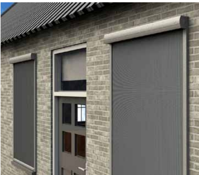
Rainbowsol Zipscreen Limited Edition stargrey.

Naast de ZIP-screens in de Limited Edition Stargrey blijft ook de screen-85 in de Limited Edition leverbaar. Ook voor deze screen geldt dat hij zonder meerprijs zowel in de antracietgrijze als in de nieuwe stargrey structuurlak kan worden uitgevoerd.