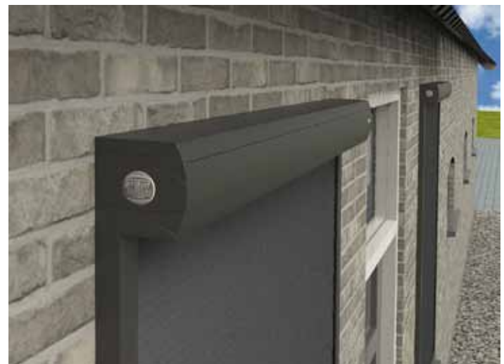
Rainbowsol Zipscreen LE.

Voor het seizoen 2013 heeft Rainbowsol de ZIP-screenlijn uitgebreid. Nieuw in het assortiment is de ZIP-screen 125, die hetzelfde design heeft als de 100-uitvoering. De ZIP-screen 125 kenmerkt zich door een grotere maatvoering tot maximaal 5,4 m breed en 4,0 m hoog tegen 4,6 m breed en 2,2 m hoog voor de ZIP-screen 100.