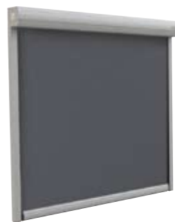
foto van ZIP-screen in Limited Edition uitvoering stargrey